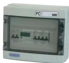
PCE NEB 6500