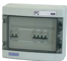
PC NEB 6500